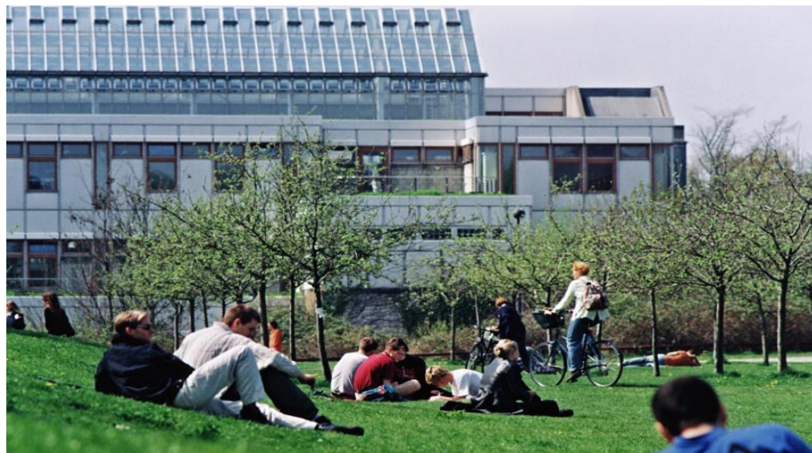
Campus der Freien Universität Berlin

Zur Verwaltung ihrer Internetauftritte haben die Fachbereiche und Einrichtungen der Freien Universität ursprünglich sehr unterschiedliche Systeme und Techniken verwendet. Gleichmaßen vielfältig waren die redaktionellen Prozesse organisiert, die häufig einen unnötig hohen Zeitaufwand erforderten. Ein übergreifender und einheitlich gestalteter Webauftritt im Sinne eines Corporate Design ließ sich auf diese Weise nur schwer umsetzen.