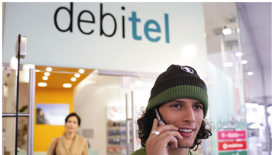
debitel bietet seine Produkte in knapp 8.000 Vertriebsstellen bundesweit an

Das Telekommunikationsunternehmen debitel AG ist mit 13 Millionen Kunden der größte deutsche Serviceprovider. Das Unternehmen bietet das komplette Telekommunikationsortiment: eigene individuelle Tarife, Zugang zu allen vier Mobilfunknetzen, DSL, Festnetz und innovative Dienste wie mobiles Fernsehen und Mobile Music. Insgesamt beschäftigt debitel rund 2.400 Mitarbeiter und erwirtschaftet einen Konzernumsatz von knapp zwei Milliarden Euro.